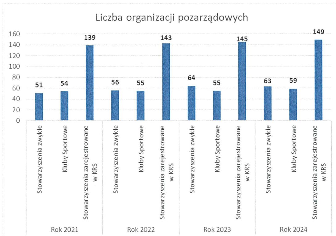
Wykres 2. Rodzaje organizacji pozarządowych działających na terenie powiatu w latach 2021 – 2024.