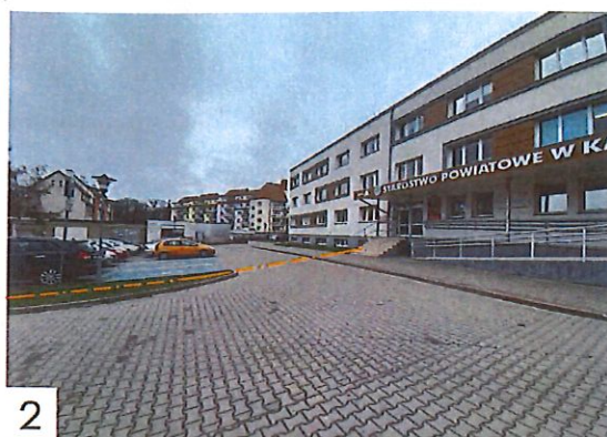
2 Projektowany kabel doprowadzić w rurociągu Ø40 do budynku Starostwa Powiatowego