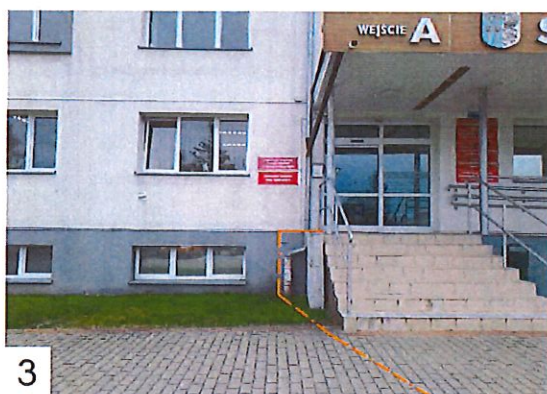
3 Projektowany kabel doprowadzić do rogu budynku, następnie wprowadzić do przedsionka i prowadzić w korycie PCV do pomieszczenia z szafą teletechniczną klienta

Ułożenie kabla pod nawierzchnią utworzoną będzie wykonywane tam gdzie to możliwe metodą bezroskopową (przeciskiem), bez konieczności jej rozbiierania