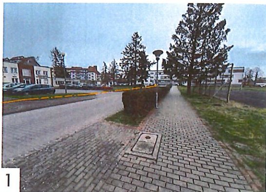
1 Projektowany kabel światłowodowy prowadzić w projektowanym rurociągu Ø40 od ostatniej istniejącej studni do budynku klienta