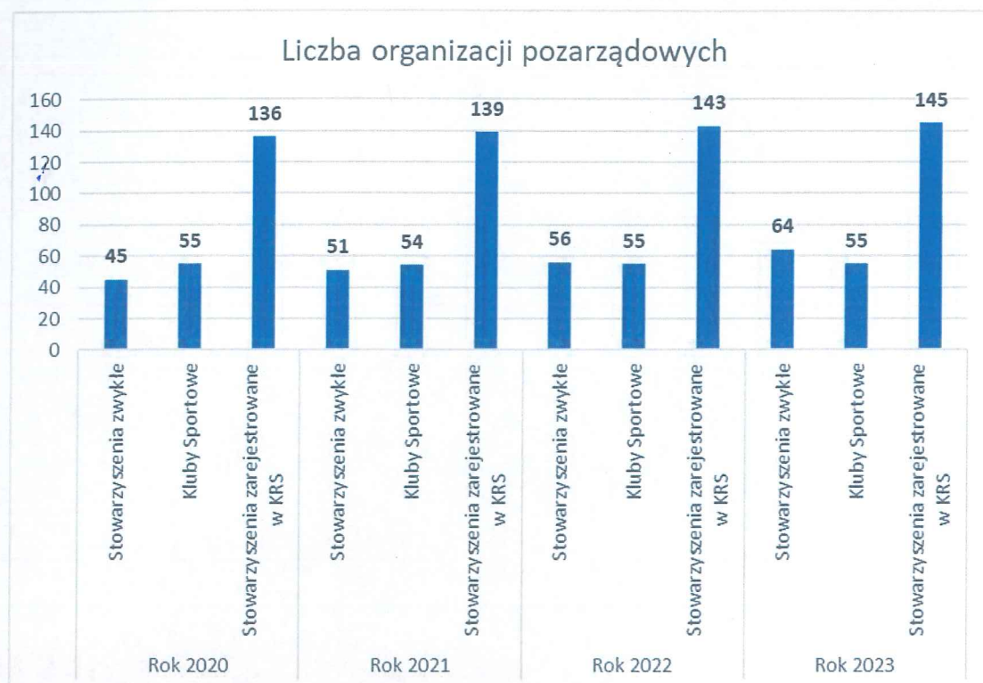
Wykres 2. Rodzaje organizacji pozarządowych działających na terenie powiatu w latach 2020 – 2023.